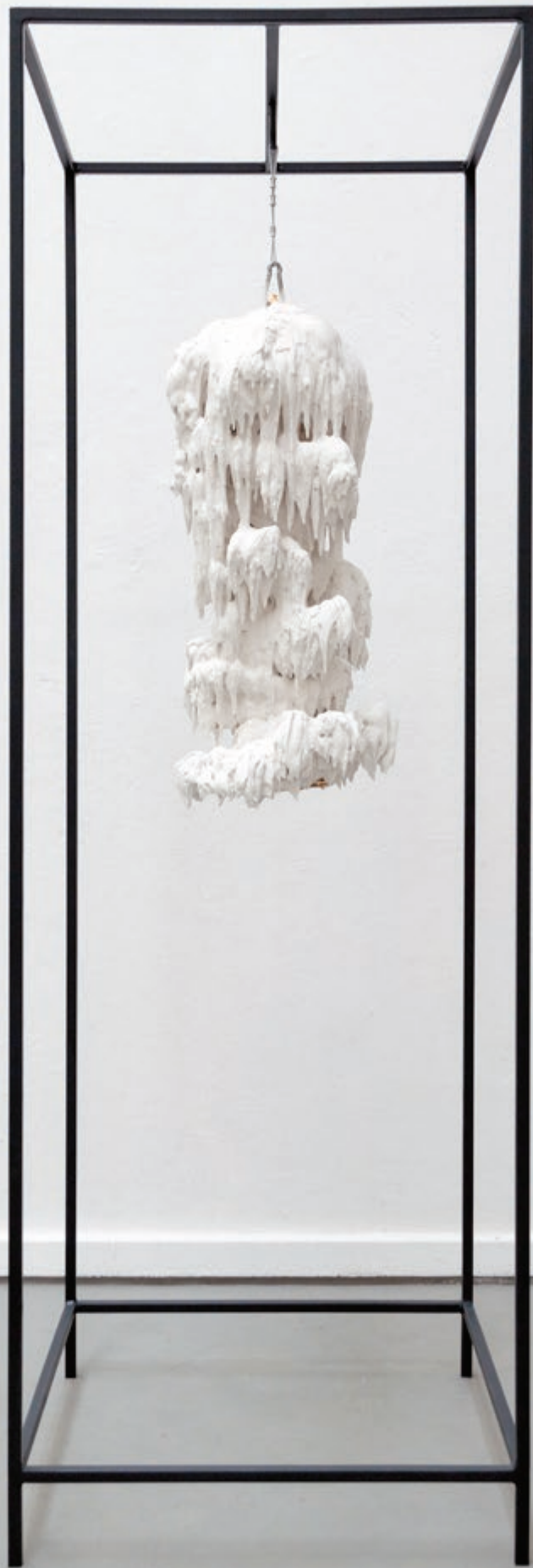
CONCRÉTIONS I (TROPFSTEIN )I 2016, pierre calcaire, plâtre et acier, 120 kg, pièce unique Portique : H 220 x 75 x 75 cm Collection Fondation de l'eau - François Schneider