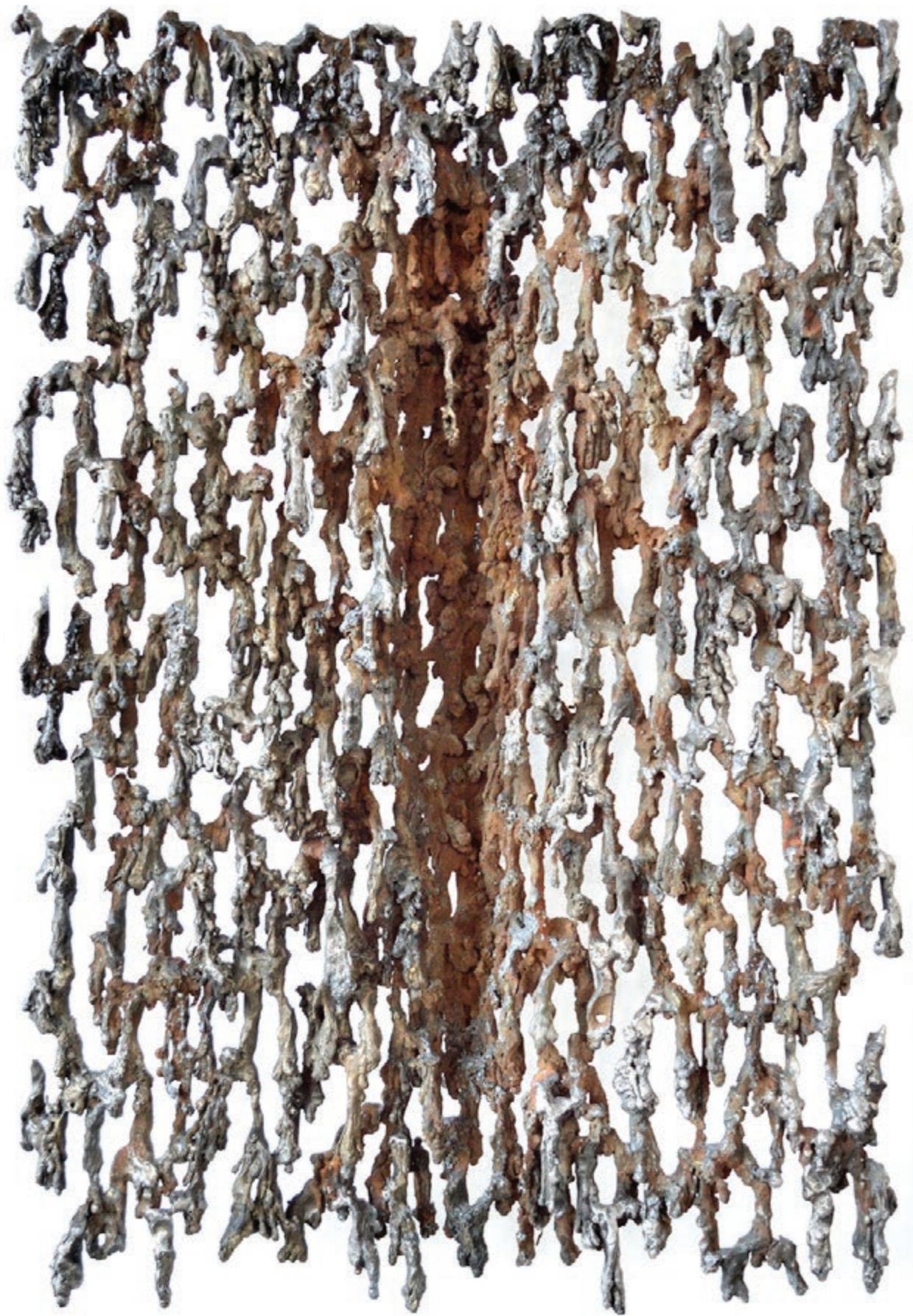
EISEN-RELIEF, YGGDRASIL L'ARBRE-MONDE 2021, Acier, pièce unique, H 86 x 60 x 18 cm, 35 kg