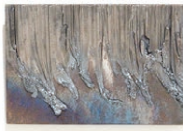
MINI-RELIEFS 2023, acier, ensemble de pièces uniques, H 14 x 20,5 x 4 cm chacun