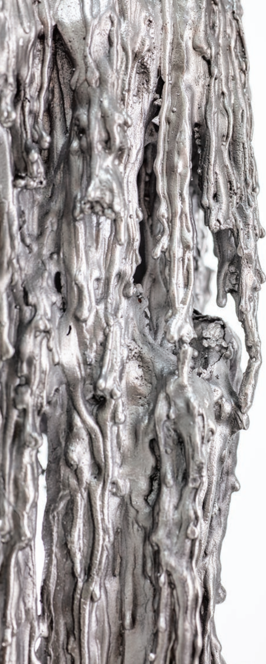
CONCRÉTION ALU H43 2020, fonte d'aluminium, pièce unique, H 43 x 20 x ø 18 cm, 4 kg