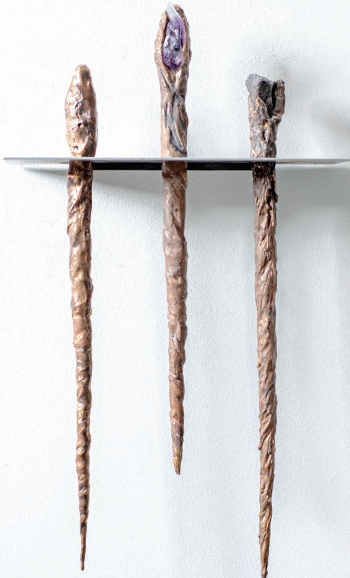
BAGUETTES MAGIQUES series avec Améthyste ou météorite, 2020, Bronze, pièces uniques, H 42 à H 45 cm x ø 0,5 à 4 cm, 1,5 kg /p