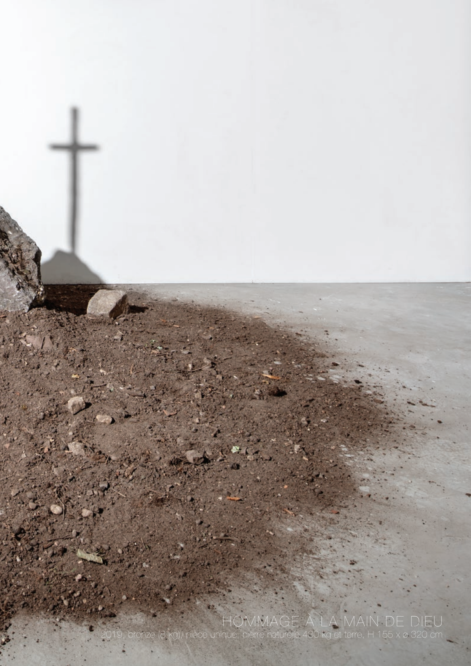
HOMMAGE À LA MAIN DE DIEU 2019, bronze (8 kg), pièce unique, pierre naturelle 430 kg et terre, H 155 x ø 320 cm