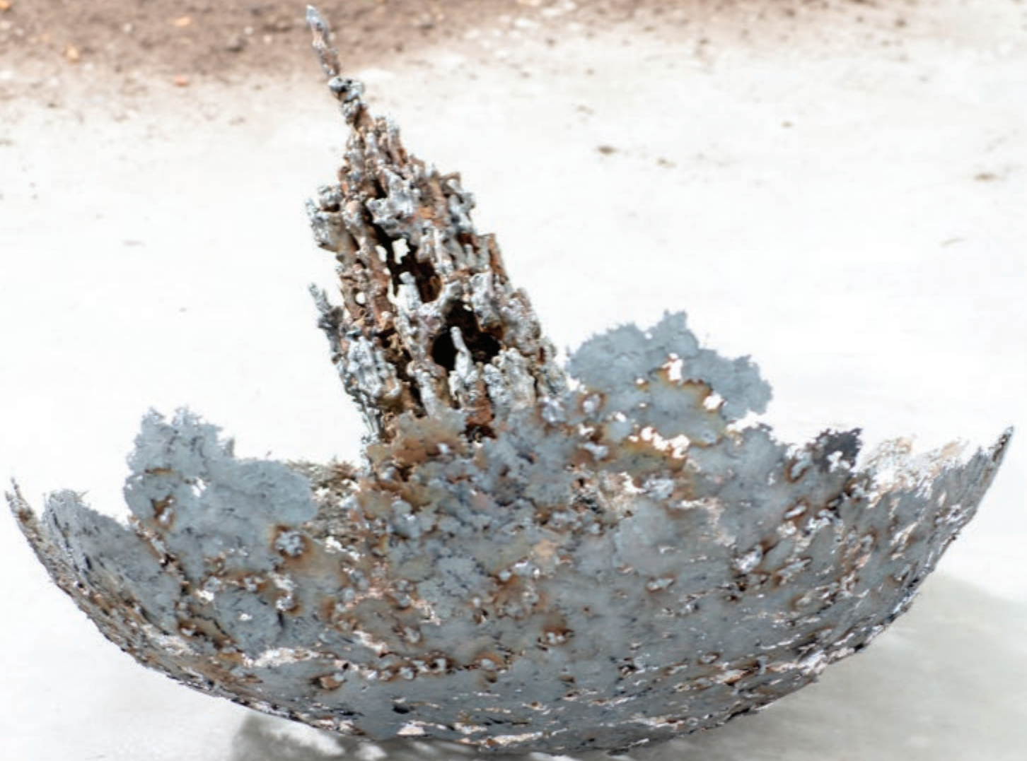
MÉTÉORITE (SOL) 2019, acier, pièce unique, H 75 x ø 90 cm