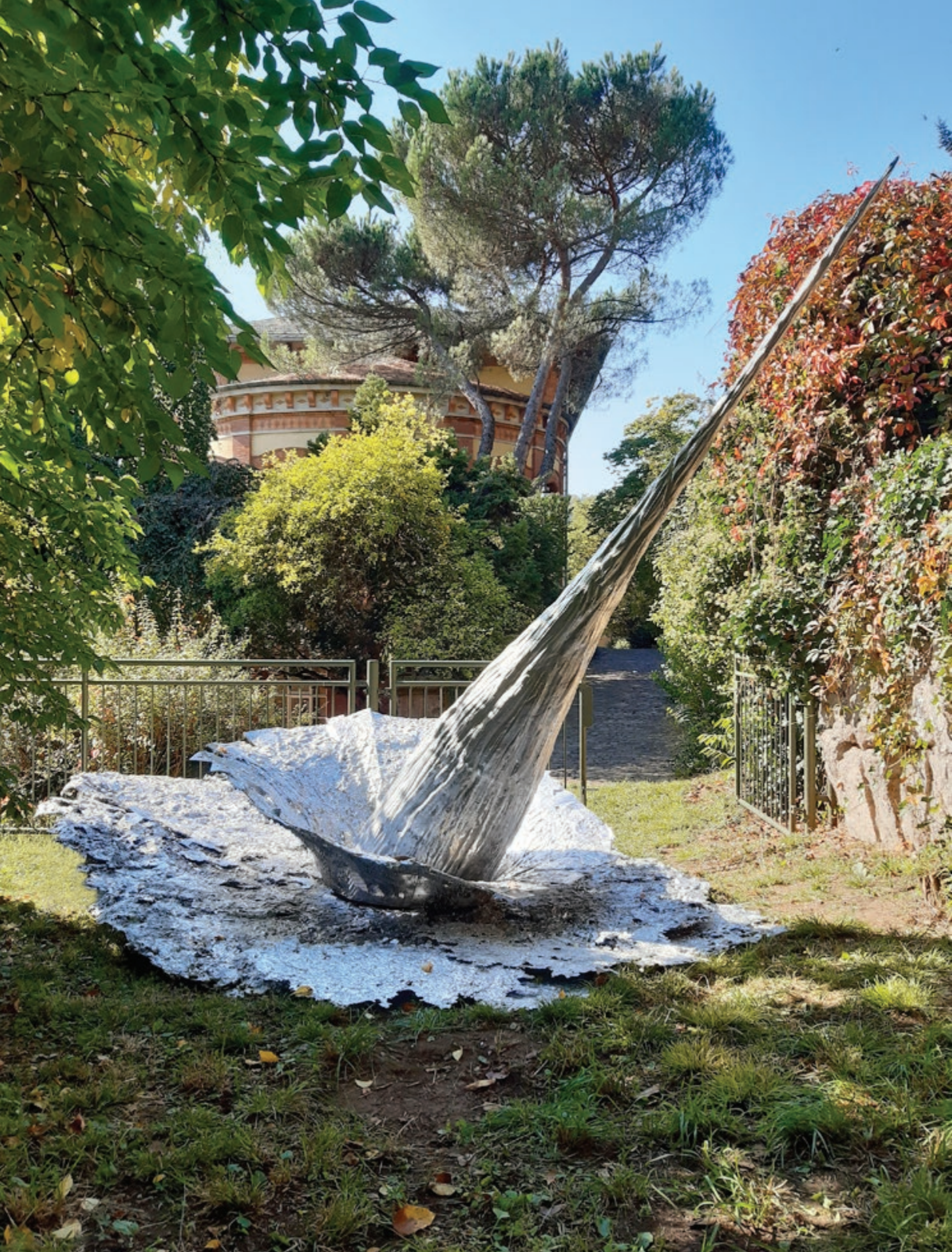
COMÈTE, HOMMAGE À NEOWISE V.2 2020 à 2021, pièce unique, aluminium, H 230 cm x ø350 cm, 180 kg