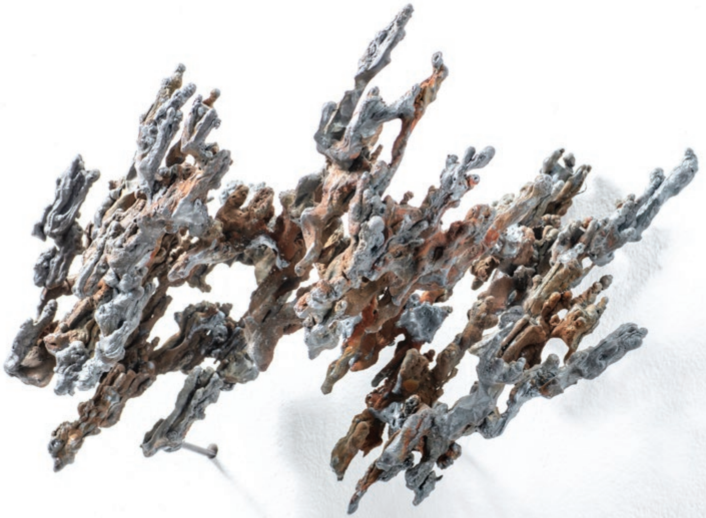
MÉTÉORITE – DUSCHII (ДУШИ) 2019, acier, pièce unique, H 35 x 62 x 30 cm, 12 kg