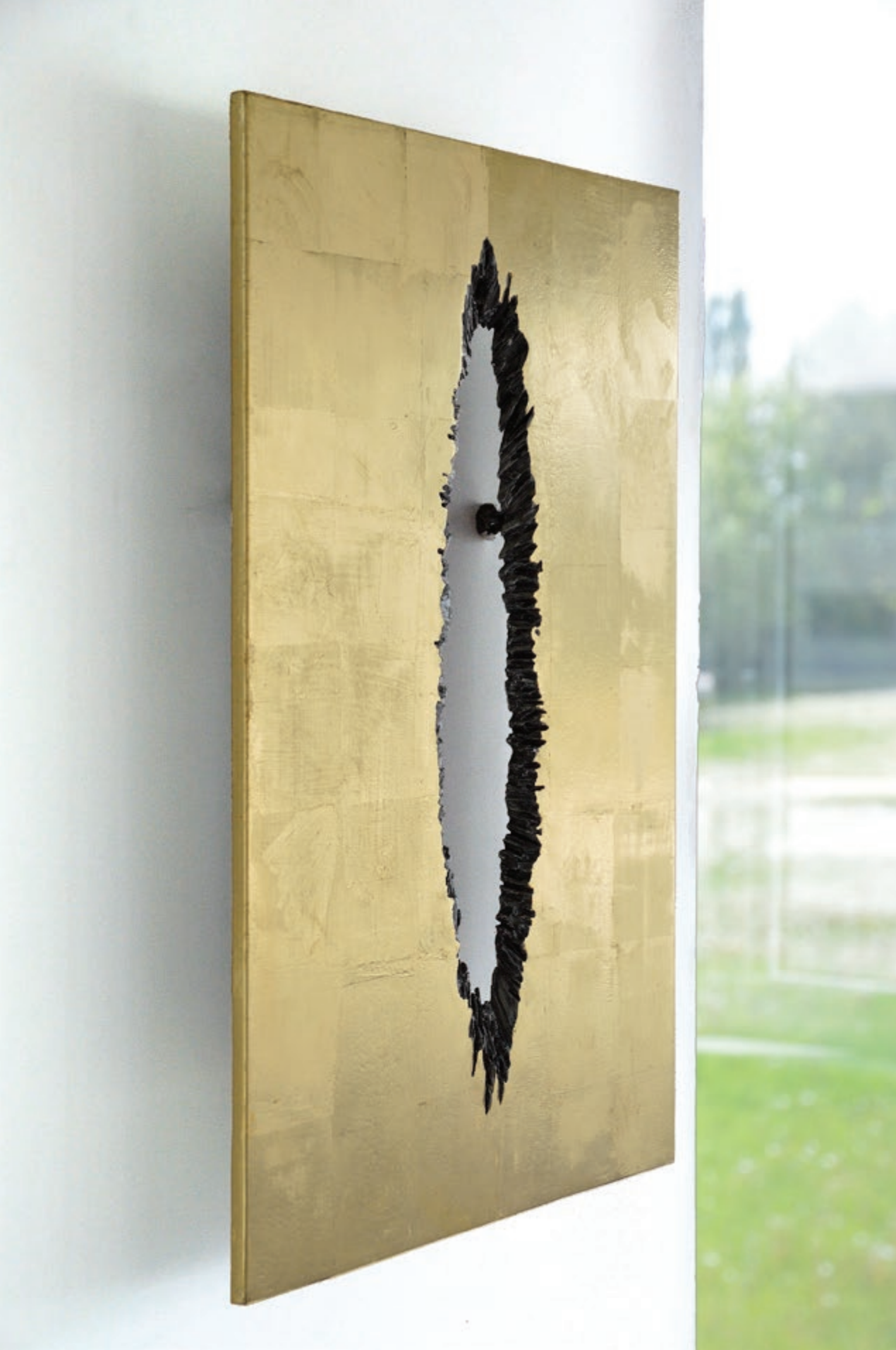
EISEN-RELIEF, HOMMAGE À LUCIO FONTANA - H57 2022, acier et or 23,75 carats, pièce unique, H 57 x 43 x 8 cm, 17 kg - collection privée