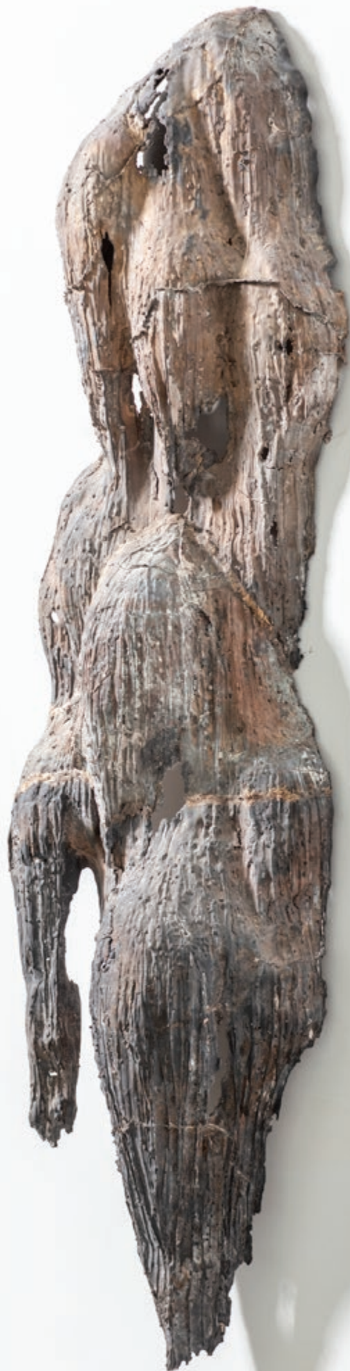
CASCADE 2019, Bronze, pièce unique, H 142 x 37 x 16 cm, 35 kg